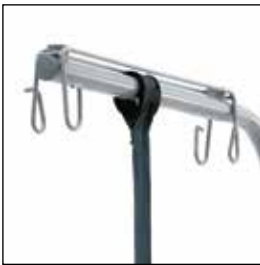
823916 IV-holder til å feste på løftebøyle