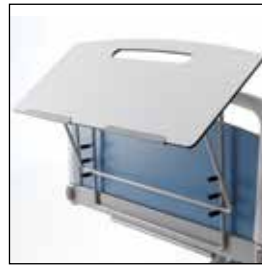
823911 Skrivebord til fotenden