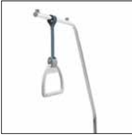
823901 Løftebøyle komplett