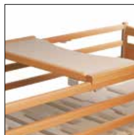
823906 Spisebrett til sidegrinder