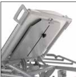
823921 Røntgenkassettholder (kun mulig med liggeflate i laminat)