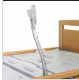
823900 Holder fleksibel til håndkontroll