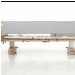
823926 Grindtrekk Pollux og Trix