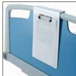
823904 Dokumentholder A4 syntetisk (horisontal)