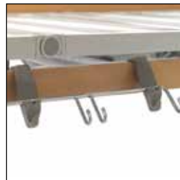
823919 Tilbehørsskinne *