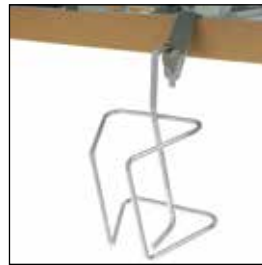
823908 Urinflaskeholder (vertikal) *