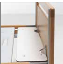
823922 Liggeflateforlenger avtakbar 823923 Liggeflateforlenger Bariatric