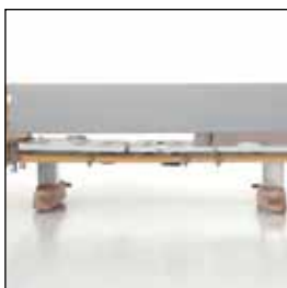
823926 Grindtrekk Pollux og Trix