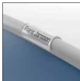
823903 Navnelappholder i plexi