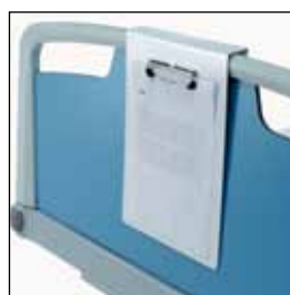
823904 Dokumentholder A4 syntetisk (horisontal) 823905 Dokumentholder A3 (vertikalt)