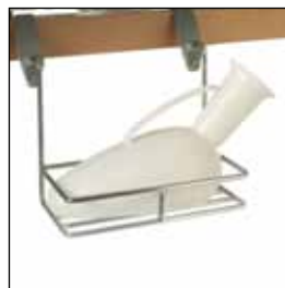
823924 Urinflaskeholder (horisontal) *