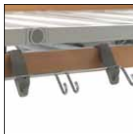
823919 Tilbehørsskinne *