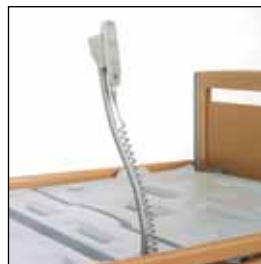
823900 Holder fleksibel til håndkontroll