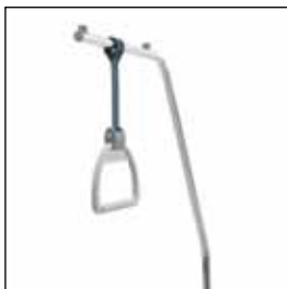
823901 Løftebøyle komplett