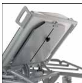
823921 Røntgenkassettholder (kun mulig med liggeflate i laminat)