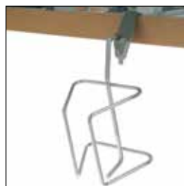
823908 Urinflaskeholder (vertikal) *