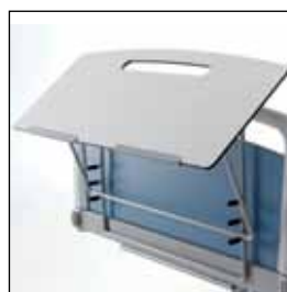
823911 Skrivebord til fotenden