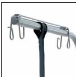
823916 IV-holder til å feste på løftebøyle