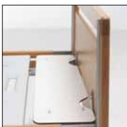
823922 Liggeflateforlenger avtakbar 823923 Liggeflateforlenger Bariatric